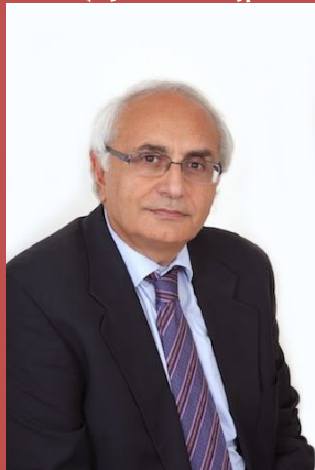
κ. Χρήστος Δήμας

Επί έξι χρόνια ήταν στρατιωτικός ακόλουθος και ακόλουθος Άμυνας στην ελληνική πρεσβεία της Αγκυρας. Κατά τη διάρκεια των Ολυμπιακών Αγώνων το 2004 ήταν διευθυντής Πληροφοριών του ΓΕΕΘΑ. Έχει διατελέσει διοικητής Τάγματος και Ταξιαρχίας Πεζοναυτών, Μηχανοκίνητης Μεραρχίας, Σώματος Στρατού, Στρατιάς καθώς και Γενικός Επιθεωρητής Στρατού. Από το 2009 έως το 2011 διετέλεσε αρχηγός του ΓΕΣ. Το 2012 διετέλεσε υπουργός Εθνικής Άμυνας επί πρωθυπουργίας Π. Πικραμένου (υπηρεσιακή Κυβέρνηση). Έχει εκδώσει δύο βιβλία με τίτλο “Χωρίς Ιππείς. Η Μάχη του Μαραθώνα (490 π.Χ.) 2.500 χρόνια” , και το “Ποια Τουρκία; Ποιοι Τούρκοι;”